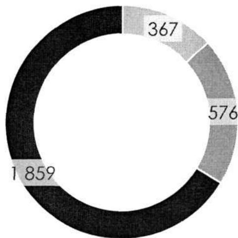
Распределение номенклатуры закупаемой продукции в 2021 году объем и доля закупок, млрд рублей

Высокотехнологичный сектор (13,1%) Массовый сектор (20,6%) Производственный сектор (66,3%)