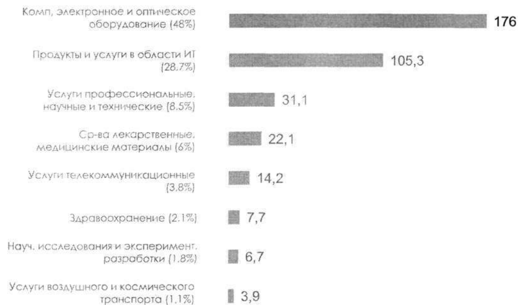
Распределение номенклатуры продукции высокотехнологичного сектора в 2021 году объем и доля закупок, млрд рублей

Высокотехнологичный сектор (13,1%) Массовый сектор (20,6%) Производственный сектор (66,3%)