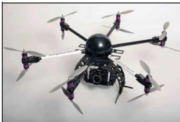
Рис. № 5 - многомоторный БПЛА.

Тип БПЛА, который с каждым днем получают все большее распространение, - многооторные системы. Их еще называют мультикоптерами, квадрокоптерами, гексакоптерами, октакоптерами и тому подобное, в зависимости от количества несущих винтов. Характерная особенность - многомоторная система, принцип полета - подобен вертолетному (рис. № 5).