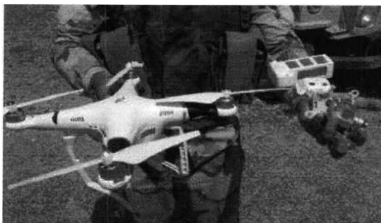
Рис. № 1 - БВС вертолетного типа.

Для совершения диверсионных актов могут использоваться БВС самолетного и вертолетного типа (рис. № 1) кустарного производства, причем доля последних значительно превышает количество самолетных. Объясняется это в первую очередь их более низкой стоимостью.