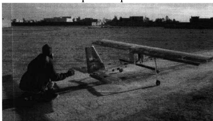
Рис. № 4 - малогабаритный летательный аппарат.

БВС-камикадзе является весьма специфичным классом беспилотной техники, информация о котором чаще всего носит секретный характер. Такой дрон представляет собой малогабаритный летательный аппарат (рис. № 4), способный нести несколько килограмм взрывчатки.