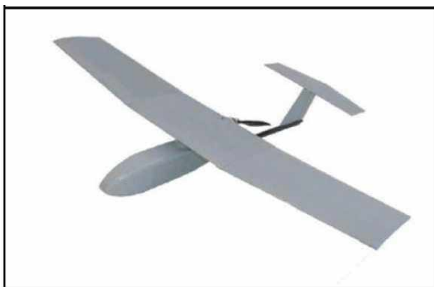
Рис. № 6 – БПЛА самолетного типа.

Существуют БПЛА, предназначенные для выполнения задач РЭР, РЭБ и связи. Скоростной диапазон работы - от 15 до 30 м/с. Рабочие высоты - в зависимости от оборудования и размеров аппарата, но всегда превышают 300 м. Обычно это диапазон высот 300 - 2000 м. Существует несколько аэродинамических схем самолетных БПЛА. Основные аэродинамические схемы – классическая (рис. № 6) и «летающее крыло» (рис. № 7).