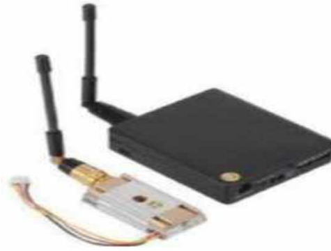
Рис. № 10 - Видеопередатчик.

Видеопередатчик (рис. № 10) - это устройство, передающее на наземную станцию изображение с камер БПЛА. Является самым заметным устройством на борту БПЛА, поэтому без необходимости включать его не стоит (это касается только тех БПЛА, которые хранят фотографии на борту), соблюдая режим радиомолчания. Такой режим уменьшает возможность применения противником средств РЭБ.