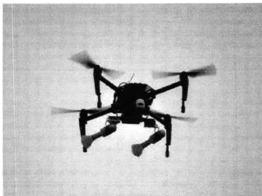
Рис. № 3 – квадрокоптер.

На квадрокоптерах также изменяется система управления камерой таким образом, чтобы над целью вытягивать леску и высвободить гранату. Корпус может быть пластмассовый и снабжен небольшим количеством поражающих элементов. Основу для самодельных бомб могут составить переделанные фабричные боеприпасы. Например, выстрелы ВОГ-17А и ВОГ-17М. Также используются безгильзовые гранаты ВОГ-25. Взрыв ВОГ сравним со взрывом ручной гранаты РГД-5. При взрыве ВОГ-25 образуется большая масса мелких осколков, которые обеспечивают сплошное покрытие осколками в радиусе 10 метров. При таком взрыве все не защищенные участки тела поражаются осколками.