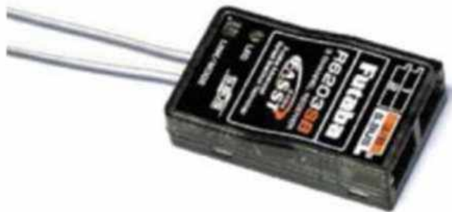
Рис. № 11 - Приемник аппаратуры управления.

Видеопередатчик (рис. № 10) - это устройство, передающее на наземную станцию изображение с камер БПЛА. Является самым заметным устройством на борту БПЛА, поэтому без необходимости включать его не стоит (это касается только тех БПЛА, которые хранят фотографии на борту), соблюдая режим радиомолчания. Такой режим уменьшает возможность применения противником средств РЭБ.