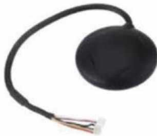
Рис. № 8 - Модуль GPS-навигации.

Рассмотрим радиопередающие системы, установленные на БПЛА.