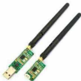
Рис. № 9 - Модем телеметрии.

Модем телеметрии (рис. № 9) - приемное устройство, предназначенное для обмена информацией между наземной станцией и БПЛА. От наземной станции он посылает команды к выполнению, от БПЛА - принимает на наземную станцию информацию, получаемую с датчиков (например, скорость, потребление тока, напряжение, положение в пространстве. Обычно является основным каналом управления БПЛА.